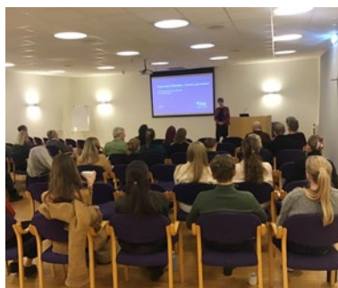
45 engasjerte leger fulgte ivrig med på foredraget: «Enda bedre folkehelse – hvorfor og hvordan?».