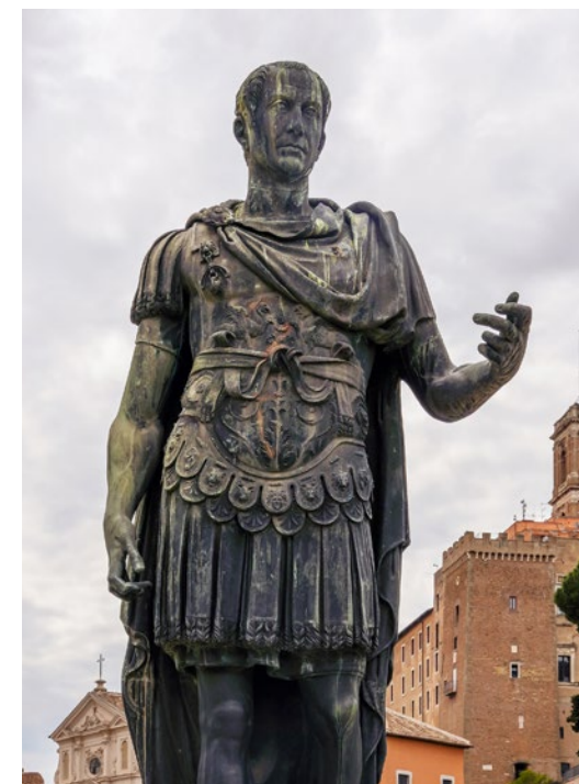
Statue av Julius Caesar i Via dei Fori Imperiali, Roma.