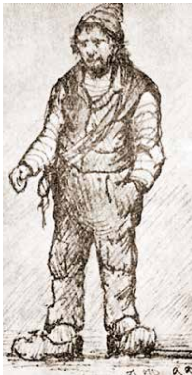
Tippe Tue slik kunstmaleren Julius Holck busket ham fra sin barndom; topphue, skjegg, tresko og med dragertauet over skulderen.

«Ja d'e' sannt osså», mumlet Sivert borte fra sengebenken. Han var enig med fasteren denne gang.