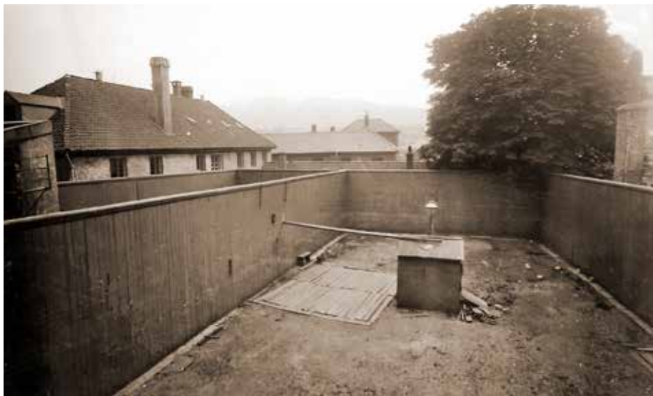
Tvangsarbeidsanstaltens lufttegård sett mot vest (se også side 69).