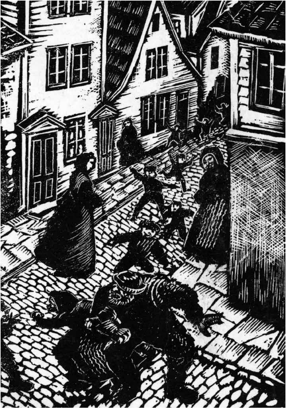
Tegning av Hans Genhard Sørensen

«Da de hadde gått litt, stod Tippe Tue stille og stakk to fingerstumper ned i vestelommen.