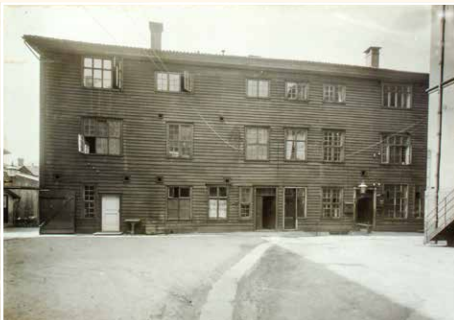
Tvangsarbeidsanstalten fra 1850 var en stor primitiv bygning i tre etasjer. Den lå på Arbeidsanstaltens bakplass, inngjerdet på alle sider. (Se kartet under (2), samt side 57 og 58.)