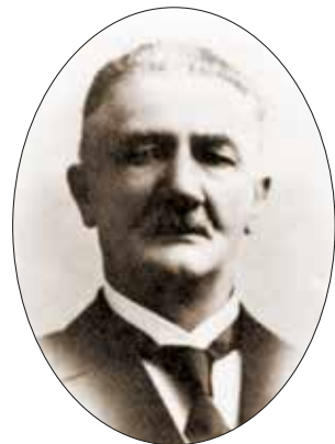
Julius Olsen, en ruvende skikkelse i bysamfunnet gjennom en mannsalder. Han var politimester i Bergen fra 1893 til 1905.

I stedet for straff ble tvangsarbeid brukt for å kontrollere prostitusjonsvirksomheten. Selv om prostituerte bare delvis kan sies å stå utsatt til for innsettelse ifølge fattiglovene, utgjorde disse en stor og etter alt å dømme økende gruppe blant de kvinnelige innsatte. Julius Olsen, politimester i Bergen