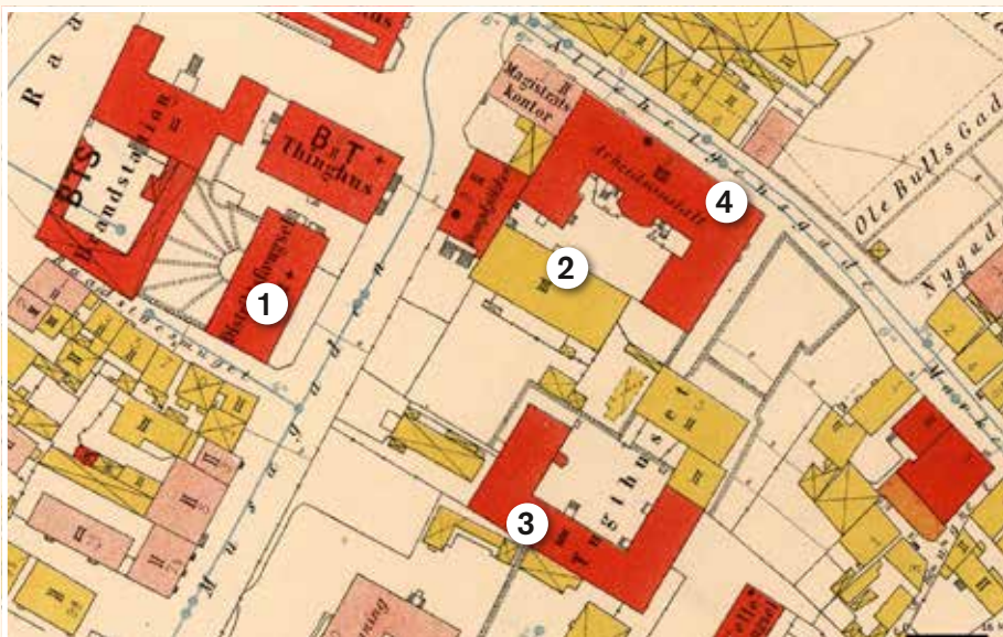
1. Det nye fengslet, 2. Tvangsarbeidsanstalten fra 1850, 3. Tukthuset (nåværende Manufakturhus), 4. Arbeidsanstalten fra 1864.