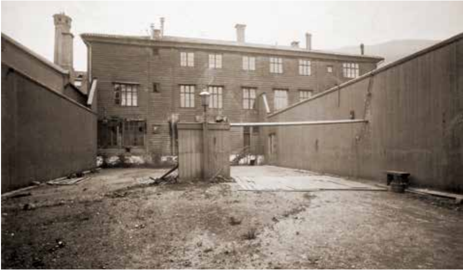
Luftegården og «Tvangen» sett mot øst (se også side 69).