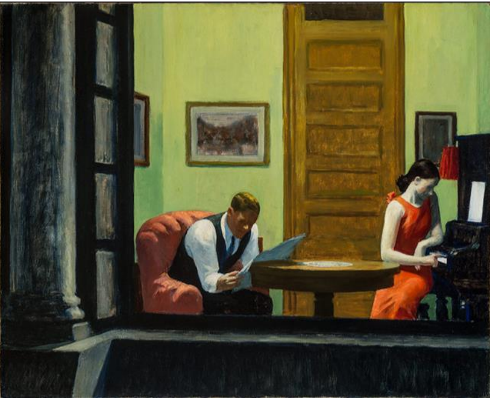
Edward Hopper, Room in New York, 1932 Museum of Modern Art, New York