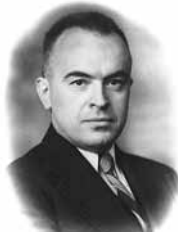
Karl Evang 1934 – 1936