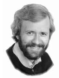
Knut Eldjarn 1984 – 1985